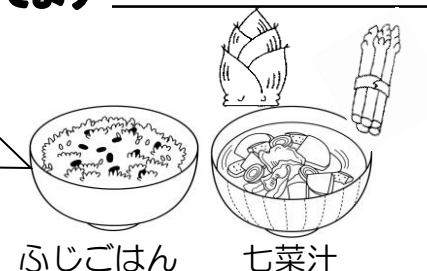
ふじごはん 七菜汁